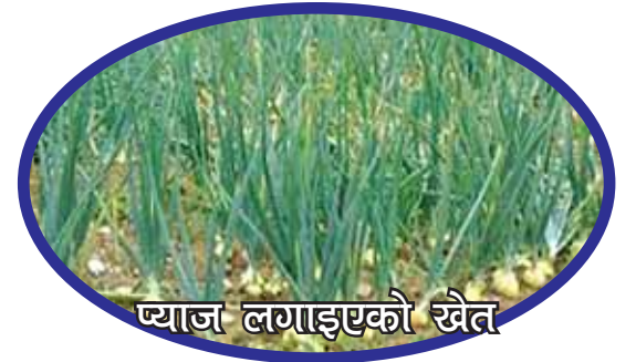
प्याज लगाइएको खेत

प्याज गाना हुने विरुवा हो र यसलाई हरियो अवस्थामा वा सुकेको गाना तरकारी वा खानाका विभिन्न परिकारमा प्रयोग गरिन्छ।