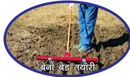
बेर्ना बेड तयारी