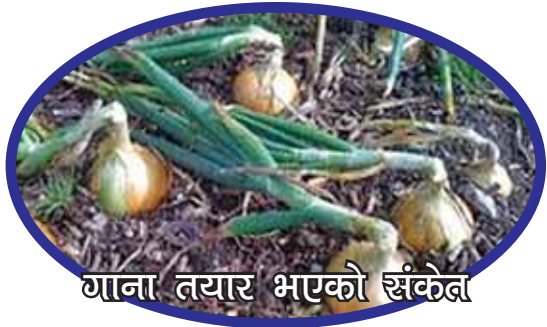
गाना तयार भएको संकेत