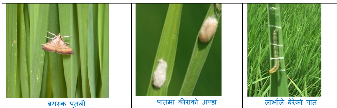
चित्र: धानको पात बेरुवा कीराको विभिन्न अवस्था

धान खेतमा पात वेरुवा कीरा ( Leaf folder ) ले नोक्सानी गर्ने समय भएकोले नियमित अनुगमन गर्नु होला। यो कीराको नोक्सानी कम गर्न को लागि: यो कीराको फुलहरु भएको पातको टुप्पो चुडेर नष्ट गर्न; नाइट्रोजन युक्त मलको सन्तुलित मात्रा प्रयोग गर्ने; धान खेतको राम्ररी गोडमेल गर्ने; नरिवलको डोरी वा अन्य काँडादार लठ्ठी लिई दुवै छेउमा समातेर दुई छेउमा बस्ने र धानलाई छुवाएर क्रमशः विपरित दिशातिर जानुपर्दछ। यसो गर्नाले धानको पातमा रहेका पात बेरुवाका लार्भाहरु पानीमा खसेर नष्ट हुन्छन्। साथै खेतमा यसको असर २५-३०% सम्म देखिएमा विषादीको प्रयोग नगर्नुहोला (यो अवस्था सम्म आर्थिक रुपमा क्षती नहुने साथै धान खेतमा भएका मित्र जीव कीराहरु नष्ट हुने भएकोले)। तर ३०% भन्दा बढी क्षती देखिएमा मात्र अल्फा म्याथ्रिन १०% ई.सी. (Alphamethrin 10% EC) १.५ मि.ली. प्रति लिटर पानीमा मिसाएर २० लिटर प्रति कठ्ठाको दरमा धानको पात भिज्ने गरी साँझको समयमा छर्नुपर्दछ।