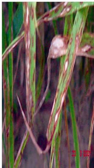
तस्विर:- धानमा लाग्ने मरुवा रोग

वीम वा अन्य कुनै ट्राइसाइक्लोजोल युक्त विषादी १ ग्राम प्रति लिटर पानीमा मिलाई छर्ने वा कासु वी २ एमएल प्रति लिटर पानीमा मिसाई ७-१० दिनको अन्तरालमा २ पटक छर्ने। नेक ब्लाष्टको व्यवस्थापनको लागी धानको बाला (पेनिकल) निक्लनु भन्दा अगाडी र धानको फूल फुलिसकेपछी माथी उल्लेखित विषादी र मात्रा मिलाएर २ पटक छर्नु पर्दछ।